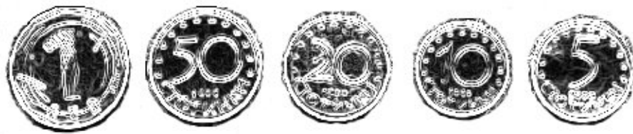
Figuro 1: Bulgaraj moneroj

BUS 7 ne asekuras siajn partoprenantojn kontraŭ malsano, akcidentoj aŭ io alia. Bonvolu atenti, ke multaj malsan-asekuroj ne asekuras malsanon en eksterlando. Konsilindas speciala asekuro por eksterlandaj vojaĝoj.