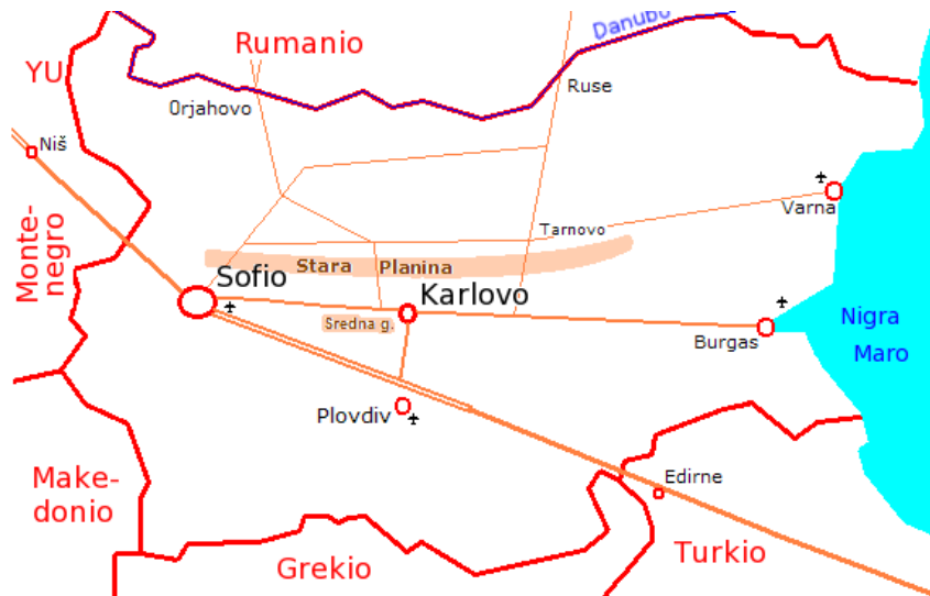
Figuro 2: Gravaj vojoj al Karlovo

Sed ne ĉiuj tiuj kursoj estas disponeblaj por ekzameno dum BUS 7. Ĉe intereso bonvolu informiĝi ĉe la klerigofico.